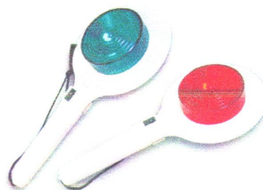
Fot.3 Tarcza do kierowania ruchem podświetlana