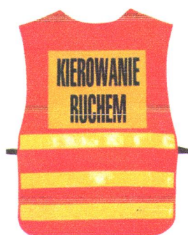
Fot.1 Kamizelka „KIEROWANIE RUCHEM”

Pracownicy powinni być wyposażeni w odzież ochronną i sprzęt ochrony osobistej posiadające odpowiednie atesty. Osoby kierujące ruchem wahadłowym powinny posiadać kamizelki koloru pomarańczowego z napisem „Kierowanie ruchem” [fot. 1] oraz tarcze do zatrzymywania pojazdów [fot. 2 i 3].